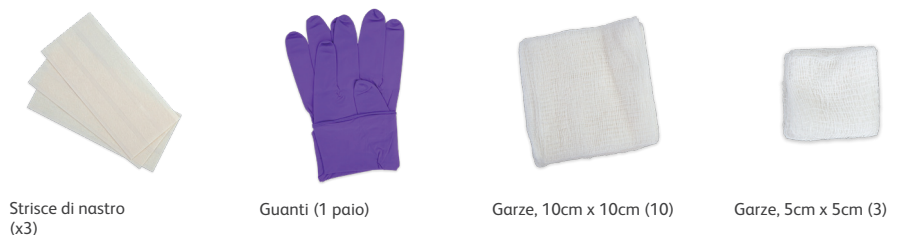
Strisce di nastro (x3)